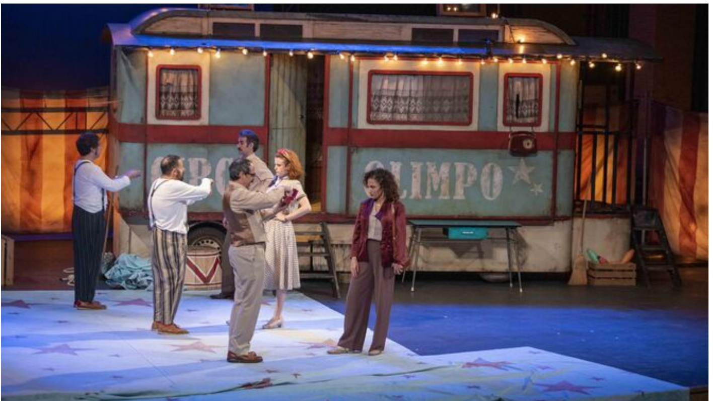
Escena de ‘Anfitrión’ el pasado viernes en el Maestro Padilla.

• Pepón Nieto, Toni Acosta, Fele Martínez y María Ordóñez protagonizan esta divertida comedia