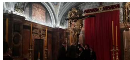
Traslado del Calvario 2019