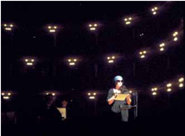
XI Maratón de Monólogos celebrado en colaboración con la ESAD y el Gran Teatro de Córdoba.