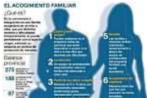
275 niños que están bajo protección de la Junta residen con familias de acogida