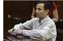
Las peripecias del recluso Bretón